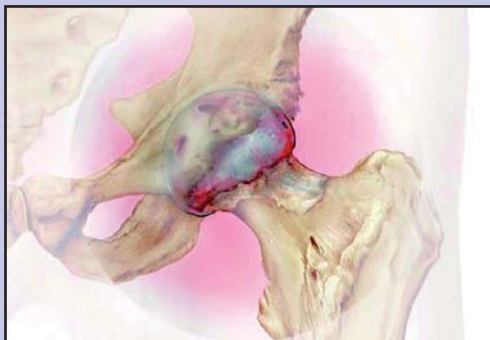
Hüfte mit Arthrose