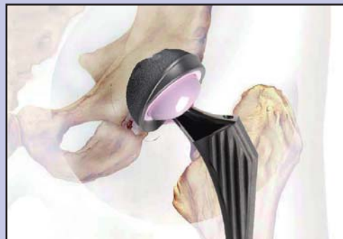
Hüfte mit Prothese